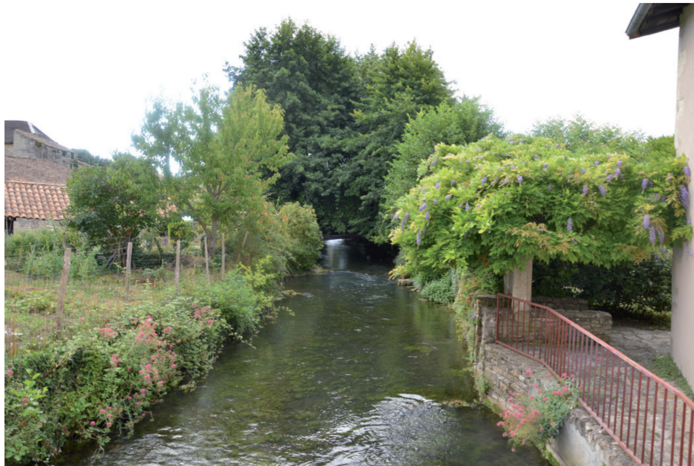
Photographie 1 : La Sèvre Niortaise au niveau de La Mothe-St-Héray

L'AEE est traversée du nord-ouest au sud-est par l'anticlinal de Melle, présentant les altitudes les plus importantes du territoire.